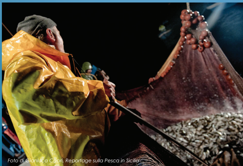
Reportage sulla Pesca in Sicilia

Le Regioni sono partner istituzionali per l'attuazione del Programma. Un ruolo di primo piano è svolto dai Gruppi di Azione Costiera (GAC) che hanno il compito di rafforzare il ruolo delle comunità di pescatori nello sviluppo locale. Il Ministero dell'Ambiente e della Tutela del Territorio e del Mare (MATM) è Autorità Competente per la VAS, di concerto con il Ministero dei Beni e delle Attività Culturali e del Turismo (MIBACT). A queste istituzioni compete l'elaborazione del parere motivato, espresso sulla base dell'istruttoria svolta e degli esiti delle consultazioni, che conclude la fase di valutazione di VAS.