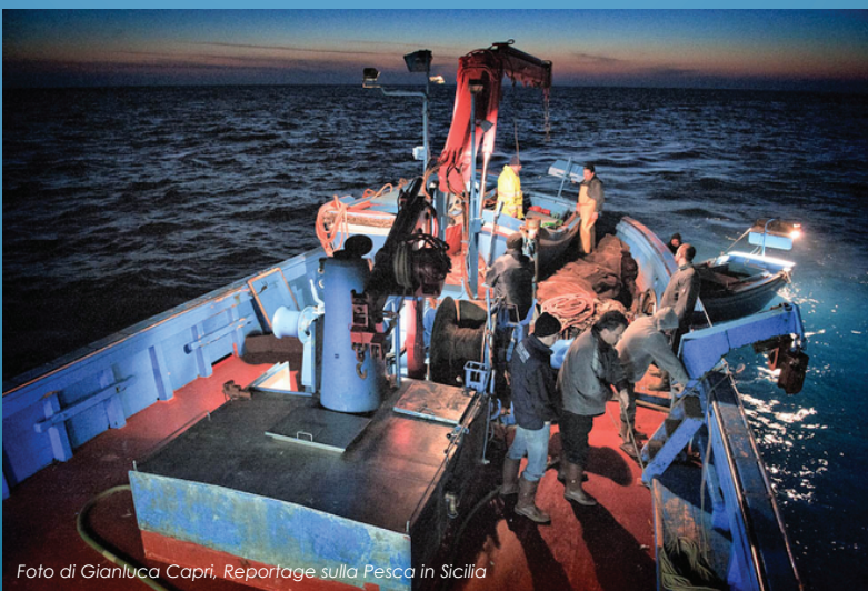
Reportage sulla Pesca in Sicilia

La pesca e l'acquacoltura hanno un forte radicamento nella tradizione italiana e hanno caratterizzato nel tempo paesaggi costieri, fluviali e lacustri. Il PO interviene a favore della valorizzazione del patrimonio culturale e paesaggistico, sia con azioni a favore delle comunità locali, sia con interventi di promozione di attività turistiche sostenibili, come pescaturismo e ittiturismo.